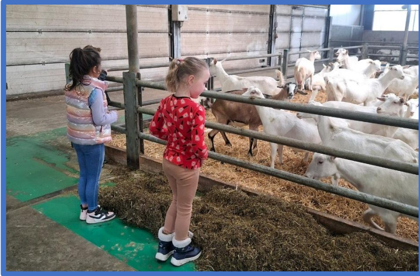
Groep 1/2 bekeek van héél dichtbij hoe geiten worden gehouden.