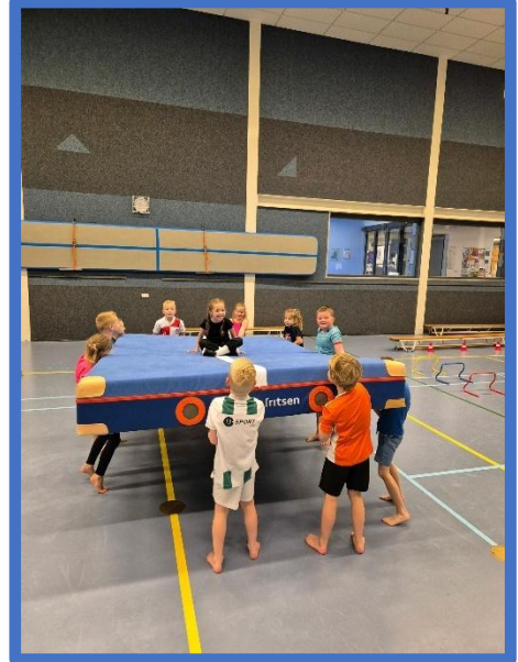
Groep 3/4 fanatiek in actie in de gymzaal.