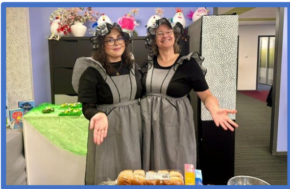
De dames van de catering tijdens de paaslunch.