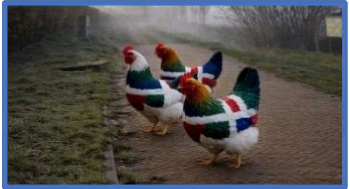
Echte Groninger kippen, gespot door een ouder van Op d'Esch rond de school 🐔